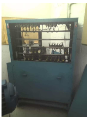
Armoire de manœuvre