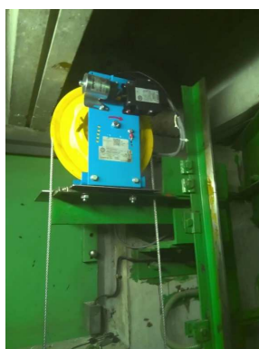
Limiteur de vitesse cabine