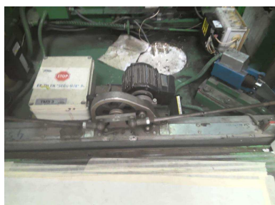
Opérateur de porte cabine (Face 1)