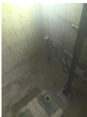
Poulie tendeuse cabine