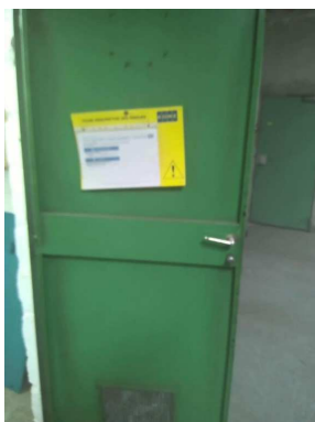
Accès machinerie 2