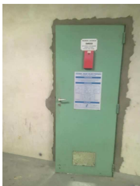
Accès machinerie 1